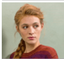
Wolle | Garne