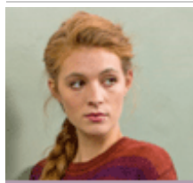
Wolle | Garne