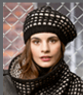
Wolle | Garne